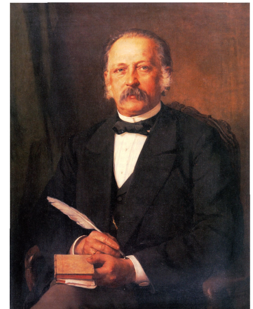
Theodor Fontane. Ölporträt von Carl Breitbach (1883).